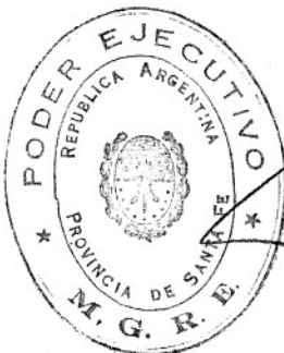
HERMES JUAN BINNER GOBERNADOR DE SANTA FE